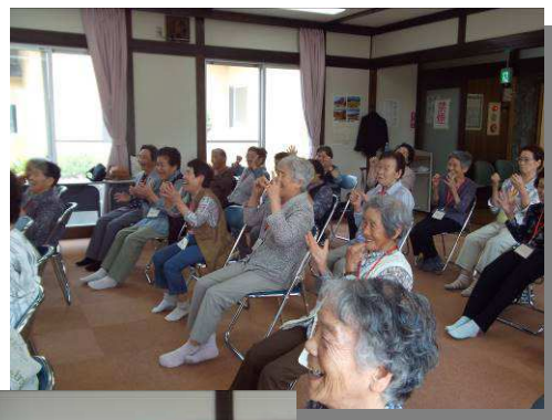
↑ 月2回のT H Fの教室の様子