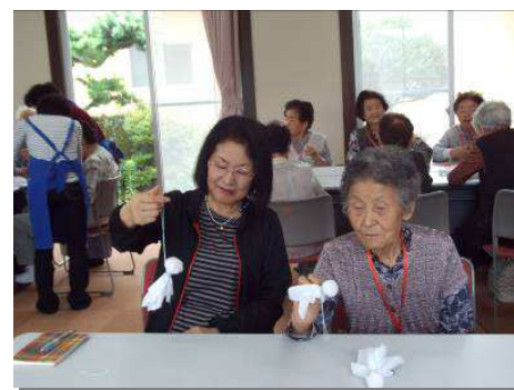
↑ てるてる坊主をつくりました

A 3. 体操は体を動かすことが好きなので喜んでしています。家ではたまにします。