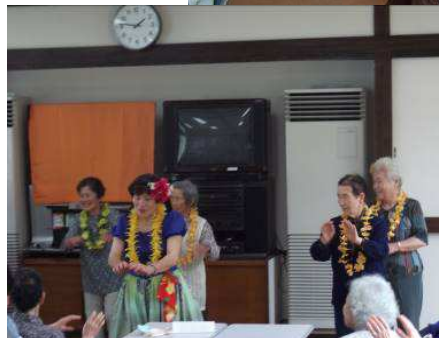
↑ よりそいカフェでフラダンスを披露